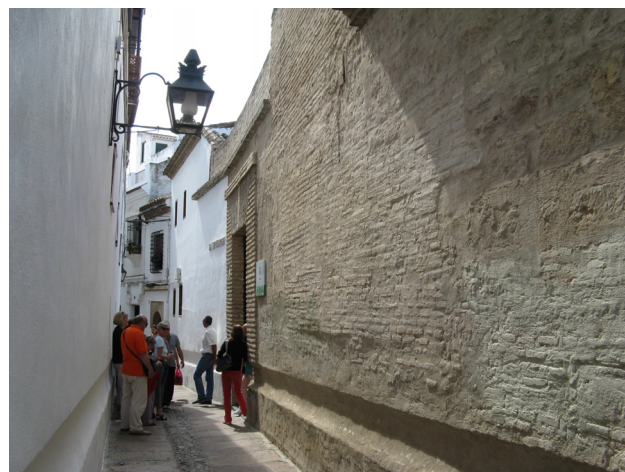
Straatje met synagoge van Cordova, woonplaats van Maimonides

Wat de Joodse denker M. Kadushin ten aanzien van ethiek opmerkt, sluit aan bij wat Maimonides zegt over de invloed van het handelen op de menselijke moraal. Ethiek is niet geworteld in een theorie, maar in de religieuze