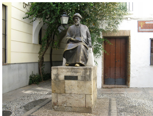
Standbeeld van Maimonides (1135-1204) in zijn geboorteplaats Cordova.

Ben Azzai sprak: “ Dat is het boek van de geboortegeschiedenissen van Adam, op de dag dat God Adam schiep, maakte Hij hem overeenkomstig de gelijkenis van God ” (Gen. 5:1), dat is een alles omvattende regel in de Tora.” Rabbi Akiva sprak: “ En je zult je naaste liefhebben, als jezelf, Ik ben de Eeuwige ” (Lev. 19:18), dat is een alles omvattende regel in de Tora; opdat je niet zegt: “Omdat ik veracht ben, laat mijn naaste ook maar veracht worden; omdat ik gekleineerd ben, laat mijn naaste ook maar gekleineerd worden, net als ik.” 2