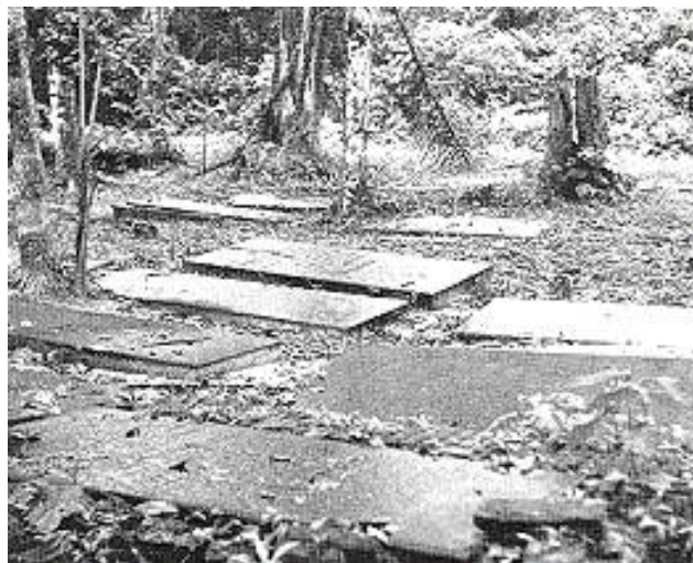
Restanten van de joodse begraafplaats

Ondanks deze optimistische kijk op hun omgeving, was het leven in Jodensavanne in de 17e en 18e eeuw niet altijd even comfortabel. In 1689 en 1712 werd Suriname aangevallen door de Fransen, die de kolonie plunderden en veel schade veroorzaakten ook aan de joodse planters. Ook werden zij regelmatig aangevallen door indianen en maronen (gevluchte slaven). Dan werden de aanvallers verdreven en opgejaagd tot in de jungle. Verschillende joodse commandanten zijn bekend die leiding gaven aan dit soort operaties. Onder hen bevonden zich Samuel Cohen Nassy en David Nassy. De laatste joeg zelfs op de aanvallers op Jom Kippoer. Hij stierf in 1734 tijdens of kort na een van