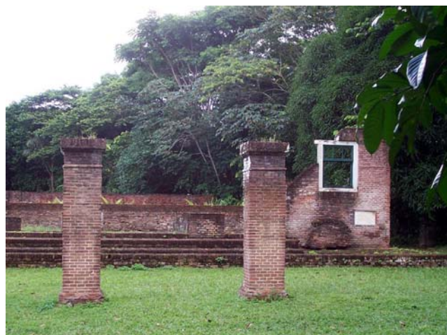
Ruïne van de synagoge van Jodensavanne in 2006

Na de bloeiperiode in de 17e en begin 18e eeuw, vond er echter een economische recessie plaats in de 2e helft van de 18e eeuw (1765-1775). Deze werd veroorzaakt door de toename van grote leningen - in het bijzonder door de firma "Deutz" in Amsterdam -, die niet gebruikt werden voor verbetering van de landerijen, maar die vaak onverstandig werden gependend, wat voortdurend resulteerde in uitstel van betaling. De bewoners begonnen Jodensavanne te verlaten en