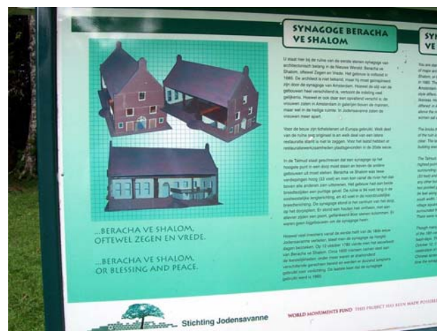
Informatiebord met afbeelding van de synagoge Beracha Ve Shalom

Op 11 oktober 1971 werd met medewerking van de overheid de Stichting Joden Savanne (SJS) opgericht en konden de ruïnes van de synagoge en de begraafplaats wederom worden gerestaureerd. Er werden stappen ondernomen om een openluchtmuseum in Jodensavanne te vestigen. Het plan werd uitgevoerd in 1973 en op 14 augustus van dat jaar vond de officiële ingebruikstelling van het complex plaats. Een klein traditioneel huis uit de Wagenwegstraat in Paramaribo werd herbouwd op het terrein om de bezoekers van accommodatie te voorzien. Aanvullende faciliteiten en een opzichterswoning werden gebouwd op een onopvallende plek. In de jaren daarna werd de Savanne een aantrekkelijke en populaire plek voor de bevolking van Suriname.