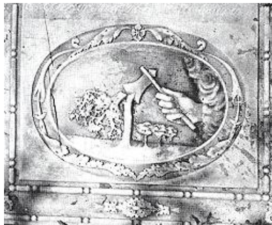
Decoratie op een grafsteen op de begraafplaats van Jodensavanne

In 1967 werd door de TRIS, de Nederlandse Troepenmacht in Suriname, Jodensavanne opnieuw in een behoorlijke staat gebracht. Bij die gelegenheid