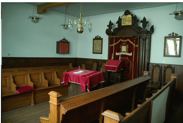
Interieur van de kleine of wintersjoel na de restauratie in de jaren tachtig

kerkraam. Duidelijk is dat de architect sterk werd beïnvloed door het in de negentiende eeuw gangbare eclectisme. Hierbij stond centraal de inspiratie door de verschillende bouwstijlen uit het verleden, welke men tot een nieuw geheel combineerde. Kennis van het werk van de Nederlandse architect P.J.H. Cuypers, wiens werk als representatief voor deze historiserende stijl kan worden beschouwd, moet Koch zeker gehad hebben. Dit wordt bevestigd door het feit dat hij samen met Cuypers heeft gewerkt aan de restauratie van de Consistoriekamer van de Grote Kerk te Zwolle in de jaren 1896-1899, precies de periode waarin ook de synagoge door Koch werd ontworpen. Een voorbeeld van deze eclectische stijl zijn de witte banden, die op de voorgevel afwisseling brengen in het baksteenmuurwerk. Zij vormen een inheems motief dat gangbaar was vanaf de vijftiende tot en met de zeventiende eeuw. Daarna komt men dit motief weer veel tegen in de negentiende-eeuwse architectuur met burgerlijke of sacrale bestemming.