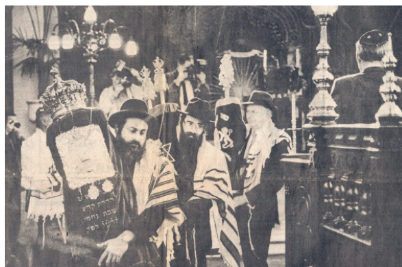
De Tora-rollen worden binnengedragen bij de herinwijding van de synagoge op 20 september 1989.

synagoge-zaal, waaronder de vrouwengalerij. Na de zomervakantie van 1989 was het dan eindelijk zover: de restauratie was voltooid.