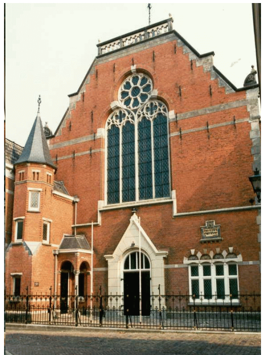
Synagoge na de restauratie in de jaren tachtig

"De Koning aller Koningen schenke haar in Zijne barmhartigheid leven, behoeft Haar en beware Haar voor allen nood, kommer en tegenwoord; Hij onderwerpe natiën aan Hare voeten, doe Hare vijanden voor Haar vallen, en waarheen Zij zich ook keere, moge Zij voorspoedig zijn!