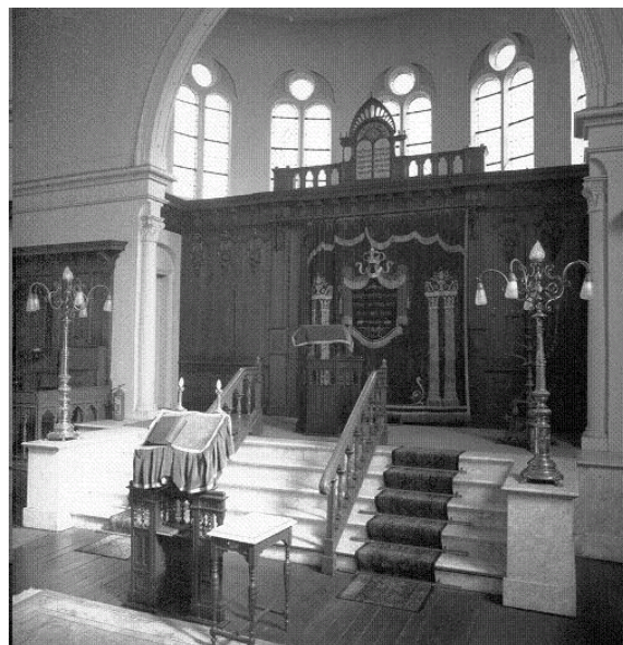
Aron Hakodesj, Heilige Ark met Tora-rollen in de oostelijke muur (situatie voorafgaand aan de restauratie).

De Joodse Gemeente van Zwolle is te klein geworden om haar synagoge in stand te houden. Daarom zal het gebouw niet alleen meer als synagoge dienst kunnen doen, maar ook ruimte moeten gaan bieden aan andere activiteiten die niet in strijd zijn met het oorspronkelijke karakter van het gebouw. Bij de restauratie is daarmee al rekening gehouden. De aanpassing van vele ruimten zoals hierboven beschreven, is vooral doorgevoerd vanwege een toekomstig gebruik van het gebouw voor culturele en educatieve doeleinden. Zo werd het achterste gedeelte van de grote synagogezaal ingericht voor concerten, lezingen en tentoonstellingen. De bovenzaal in het oude woonhuis werd geschikt gemaakt voor cursussen, vergaderingen en andere bijeenkomsten van kleinere gezelschappen. Alleen de kleine synagoge zal permanent als synagoge ingericht zijn en als zodanig blijven functioneren.