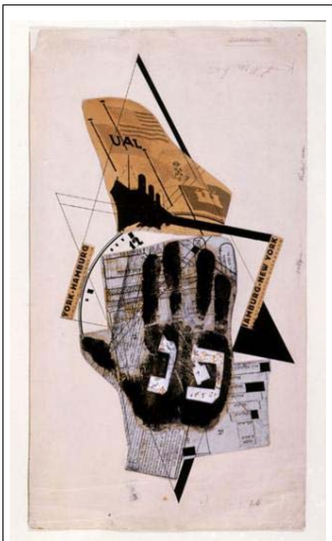
Afbeelding van Lissitzky's 'Shifs-Karta'.

De jood Osip Mandelsjtam is een sleutelfiguur van de Russische poëzie die samen met Pasternak tot de grootste Russische dichters van de twintigste eeuw wordt gerekend. Hij koos voor een heldere en directe koers van de Russische poëzie. Hij moest in de loop van de jaren twintig van de vorige eeuw als vertaler gaan werken omdat hij uit de gunst was geraakt van de overheid. In 1924 werd hij gearresteerd omdat een gedicht van hem met kritiek op Stalin in het geheim de ronde deed. In dit gedicht: "de heerser" werd Stalin omgeschreven als "Kremlinbewoner uit de bergen, de wurger en boerendoder // zijn dikke vingers vet als wormen // en zijn woorden onwrikbaar als loden gewrichten // zijn kakkerlakkensnor lacht // .....". Uiteindelijk is Mandelsjtam veroordeeld tot 'binnenlandse verbanning' en in 1938 na een gruwelijk lijden in