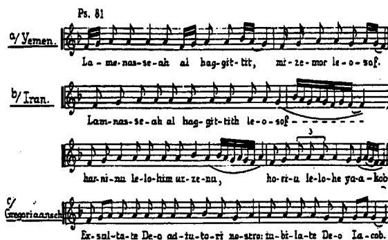
Afbeelding 1 - Vergelijking van Hebreeuwse en Gregoriaanse psalmodie (ontleend aan: Algemene muziekgeschiedenis , Prof.dr. A. Smijers, Utrecht 1938, p. 4).

Psalmodie en de meer gecompliceerde bijbelse cantillatie zijn typisch van joodse oorsprong. Pogingen hen te herleiden tot niet-joodse musicale tradities hebben allen gefaald. De beperking van de spraakzang tot een begrensde reeks noten en een gering aantal versieringen zorgt er welbewust voor dat