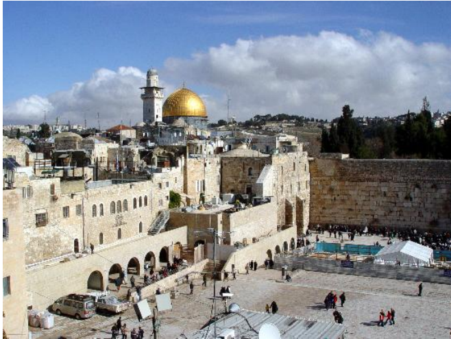
De Klaagmuur in Jeruzalem

én – wat vaak vergeten wordt – democratie is ook een goed georganiseerde publieke sector en een krachtig maatschappelijk middenveld om de belangen van burgers, organisaties en bedrijven te beschermen en te behartigen. Democratie stoelt ook op doodgewone zaken als: