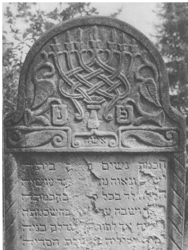
Foto 2 – Matseive in Lesko, een stad in het uiterste Zuidoosten van Polen. Het maakt evenals Czernowitz in Oekraïne deel uit van de Karpaten.

In hun interessante boek Traditional Jewish Papercuts: An Inner World of Art and Symbol (Hanover 2002) schrijven Joseph and Yehudit Shadur dat de ingewikkelde en kronkelige menora -vormen nagenoeg alleen op twee plekken voorkomen: op sommige Joodse grafstenen en in de traditionele Joodse papierknipkunst, beide in Oost-Europa. Het perkamentpapier draagt dan bijvoorbeeld een mizrach - of sjiviti -inscriptie met daarbij een uitgeknipt 'oneindige knoop'- design. 1