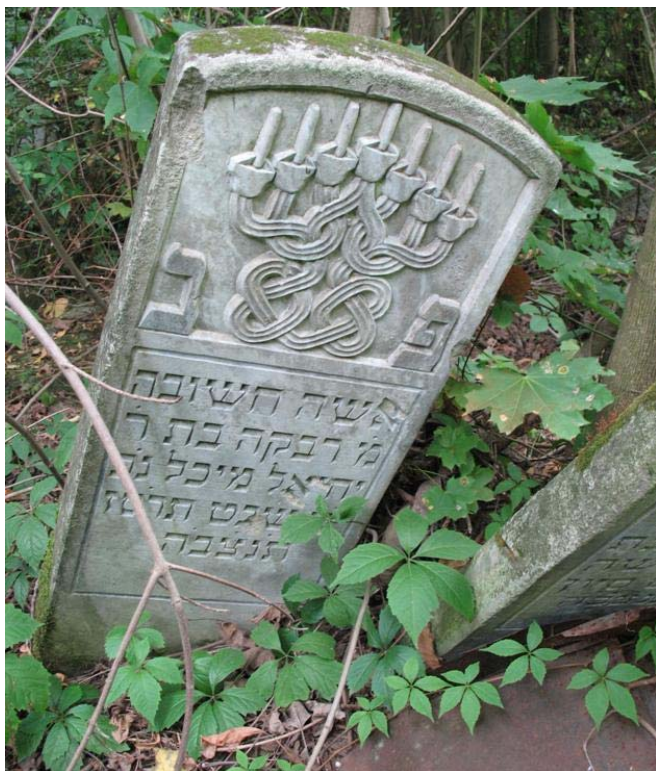
Foto 1 – Een matseive met een 'oneindige knoop' op de Joodse begraafplaats van Botosani, een stad in het noordoosten van Roemenië, dichtbij de grens met Oekraïne.

wegnemen van een stukje deeg bij het bakken van brood en de nidda, dat is de scheiding van man en vrouw gedurende de menstruatie periode.