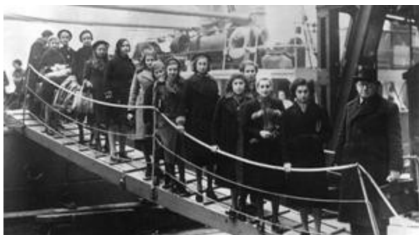
Joodse kinderen uit Polen arriveren in Londen februari 1939

obstakel is toestemming te krijgen om door Nederland te reizen, want de kinderen moeten zich in Hoek van Holland inschepen op de veerboot naar Harwich voor 'den Transport' - 'the shipment'. Juist na de Kristallnacht had de Nederlandse regering de grenzen gesloten voor Joodse vluchtelingen. De marechaussee zoekt actief naar vluchtelingen en stuurt elke opgespoorde terug naar Duitsland.