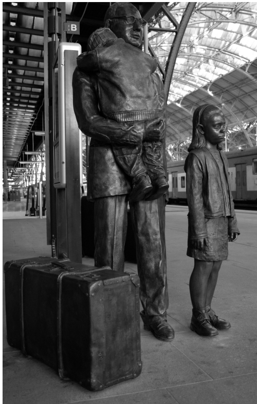
Bronzen beeldengroep met Nicholas Winton Centraal Station Praag Bewerkte foto van internet

operatie wordt later bekend als het 'Tsjechische kindertransport'.