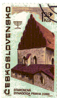
Tsjechoslowaakse postzegel uit 1967 met afbeelding van de Praagse Alneuschul die een belangrijke rol speelt in de legende van de golem

In de latere, populaire legenden over de rebbes van de Asjkenazische chassidiem, die bewonderd werden om de door hen verrichte wonderen, werd de golem een schepsel dat zijn meester diende en de taken uitvoerde die hem werden opgedragen. Dergelijke legenden ontstonden in de 15e eeuw onder Duitse joden en werden zo wijd verspreid dat zij in de 17e eeuw algemeen werden doorverteld. Een van de thema's die met de golem verbonden zijn, is dat van de ontoombare kracht van zijn elementen die vernietiging teweeg brengt. Dit is ook de strekking van de laatste en best bekende vorm van de populaire legende over de golem , te weten die over Rabbi Judah Löw ben Bezalel van Praag. Deze legende stamt overigens pas uit de tweede helft van de 18e eeuw en is als een lokale legende uit Praag verbonden aan de Altneuschul synagoge. Het verhaal wil dat Rabbi Löw de golem schiep, opdat die hem zou dienen. Maar hij was gedwongen het monster tot stof te doen wederkeren toen de golem amok begon te maken en het leven van de mensen in gevaar bracht.