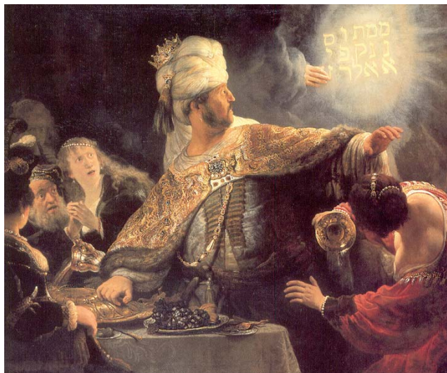
Rembrandts schilderij "Het feestmaal van koning Belsassar" (ca. 1635) met hebreeuwse letters

teld, te licht van gewicht bevonden en zal aan de Perzen worden gegeven"). Op het schilderij zien we de volgende rechthoek van letters: