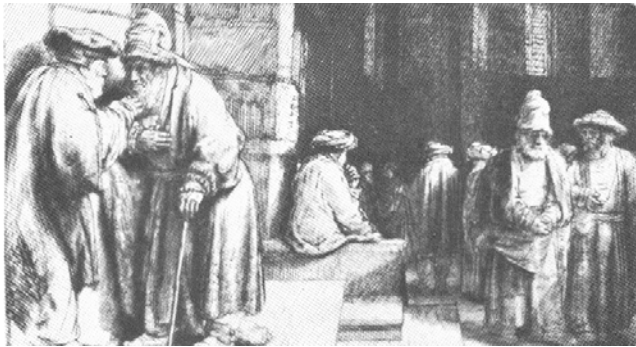
Ets van Rembrandt die lange tijd bekend stond als "Joden in de synagoge" (1648)

Als we een ets van Rembrandt bekijken die lange tijd de titel Joden in de synagoge heeft gedragen, dan valt op dat er niets joods aan te ontdekken valt. Er staan negen mannen op, geheel gekleed zoals in Rembrandts tijd gebruikelijk was, in een omgeving die meer aan een exterieur dan aan een interieur doet denken.