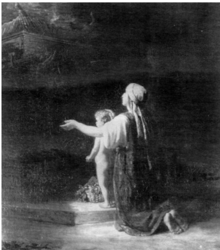
Jozef Israëls, Hannah in de tempel, 1860