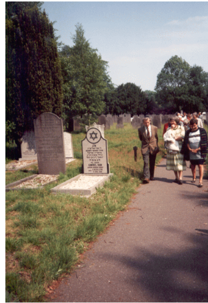
Bezoek aan de joodse begraafplaats Moscowa

Het was zondag 23 mei een prachtige dag, prima geschikt voor de tocht, die door de Stichting Judaica Zwolle, in samenwerking met het Genootschap Nederland-Israël afdeling Zwolle, voor de vierde maal werd georganiseerd.